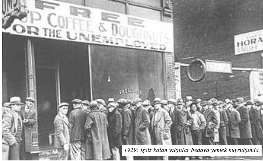
1929: İşsiz kalan yığınlar bedava yemek kuyruğunda

Bir üçüncü benzerlik, bireysel tüketim harcamalarında düşmeyle karakterize edilebilir. Şüphesiz her iki ekonomi farklı noktalardan başlama vuruşu yaptılar. Amerikan işçi sınıfı,