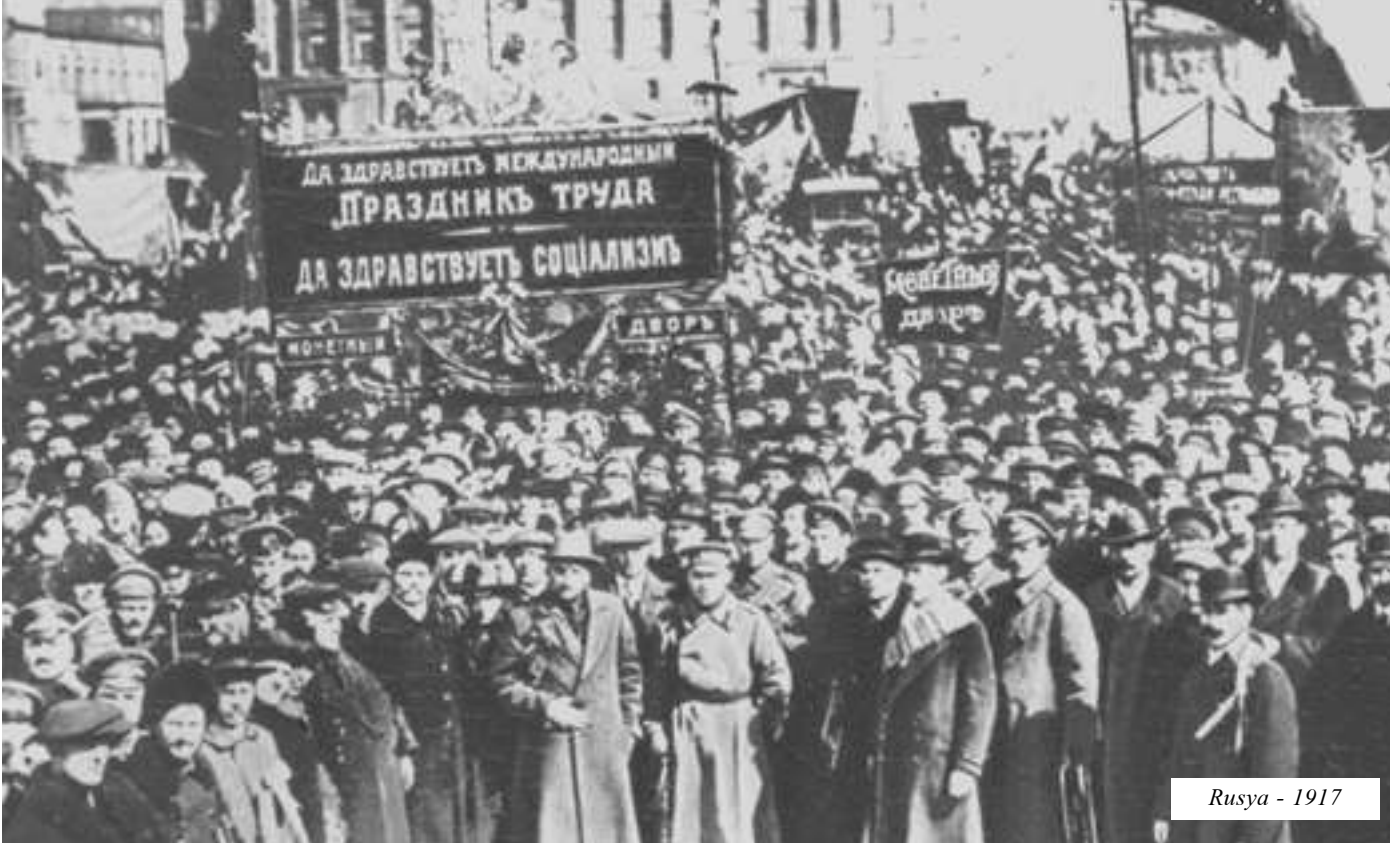
Rusya - 1917